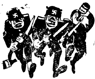
ФАШИСТСКАЯ ОПЕРАТИВНАЯ С ВОЗКОМ