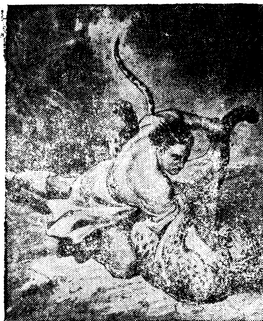
Иллюстрация к поэме М. Ю. Лермонтова „Мцыри“. Репродукция рисунка И.М. Тонца, вышедшего издательством „Искусство“.

К 100-летию со дня смерти М. Ю. Лермонтова (27 июля 1941 г.).