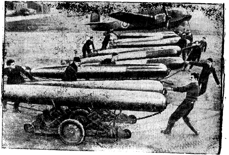
Военно-Воздушные силы Англии. Подвозка торпед к самолету на английском аэродроме.