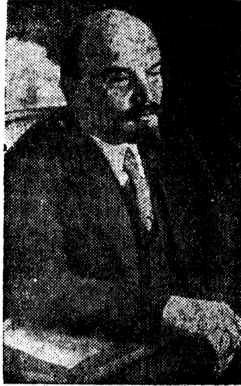
В. И. Ленин (1921 г.)

боли и печали. Проходит в тулупе старушка-крестьянка, по ее морщинистому лицу бегут слезы. Проходят Иваново-Вознесенские ткачи с любовью вытканной