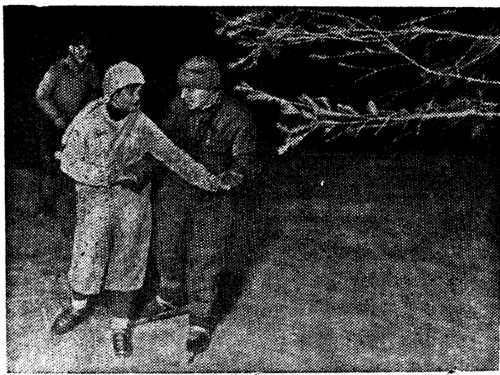
Вечером на Хабаровском катке «Динамо».