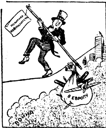
Рисунок В. Лисевича.