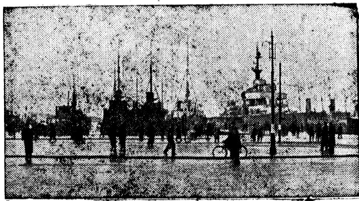
Немецкие военные и транспортные суда в порту Осло.