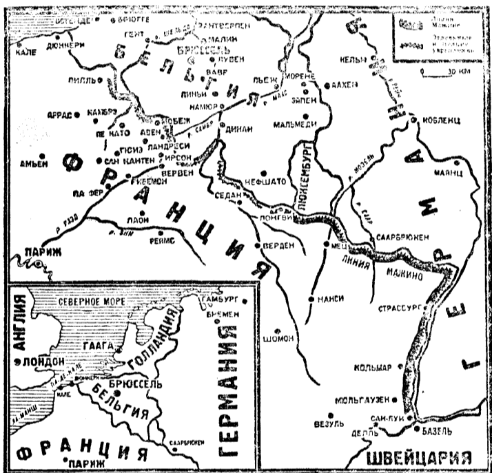
К военным операциям в Западной Европе.