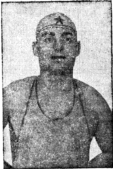
Семен Бойченко.

Заслуженный мастер спорта орденосеи Семен Бойченко 2 июня установил новый мировой рекорд в заплыве на 200 метров стилем «брасс» проплыв эту дистанцию за 2 минуты 33,7 секунды, что на 3,5 секунды выше мирового рекорда.