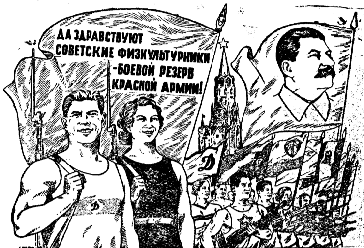
Рисунок Г. Вальк.

Дело развития физической культуры необходимо поставить под неослабное внимание партийных, советских и комсомольских организаций. Чем оперативнее будут руководить этим делом указанные организации, тем успешнее будет развиваться физкультурное движение в нашем округе. Мы не должны забывать, что физическая культура и спорт помогают воспитывать в каждом человеке железную волю, выдержку, смелость, дисциплинированность, здоровый дух коллективизма, направленный на поднятие производительности труда. Они воспитывают здоровых не только телом, но и духом, горячих патриотов нашей родины, готовых в любую минуту встать на защиту границ великой Страны Советов.