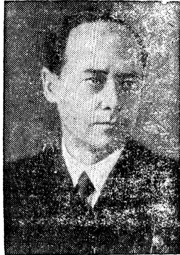
Адмирал И. С. Исаков.