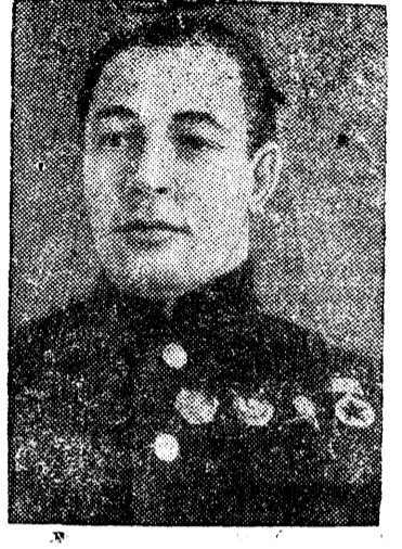
Адмирал Н. Г. Кузнецов.