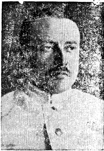
Адмирал Л. М. Галлер

Совет Народных Комиссаров Союза ССР утвердил предложения Правительственной Комиссии о присвоении лицам высшего начальствующего состава Военно-Морского Флота воинских званий, установленных Указом Президиума Верховного Совета Союза ССР от 7 мая 1940 года. Товарищам Галлеру Льву Михайловичу, Исакову Ивану Степановичу и Кузнецову Николаю Герасимовичу присвоено звание адмирала.