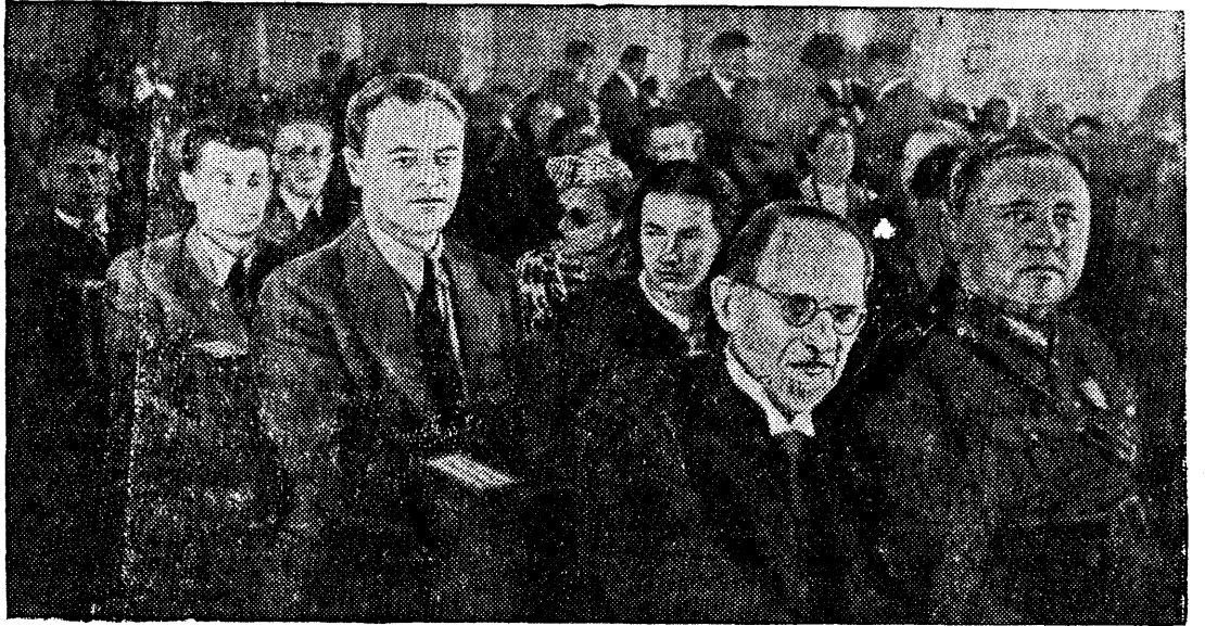
Делегация Латвийского народного сейма в зале заседаний.

1 августа в зале заседаний Верховного Совета СССР в Кремле открылась Седьмая Сессия Верховного Совета СССР. Совместное заседание Совета Союза и Совета Национальностей.