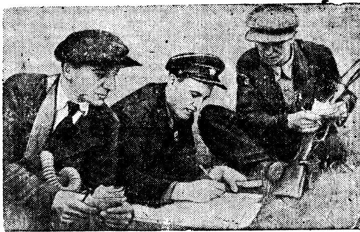
Отделение связи в походе выпускает „Боевой листок“.

Военный отдел Кировского райкома партии (Магнитогорск) организовал военную тактическую игру. В игре приняло участие около 2 тысяч человек.