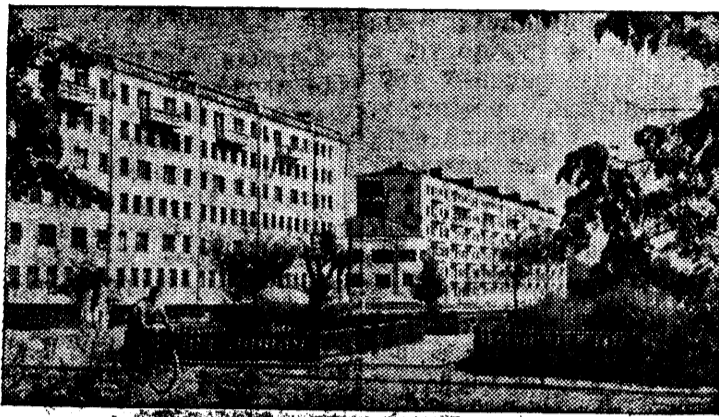
Новые дома на Обсерваторской улице в Свердловске.