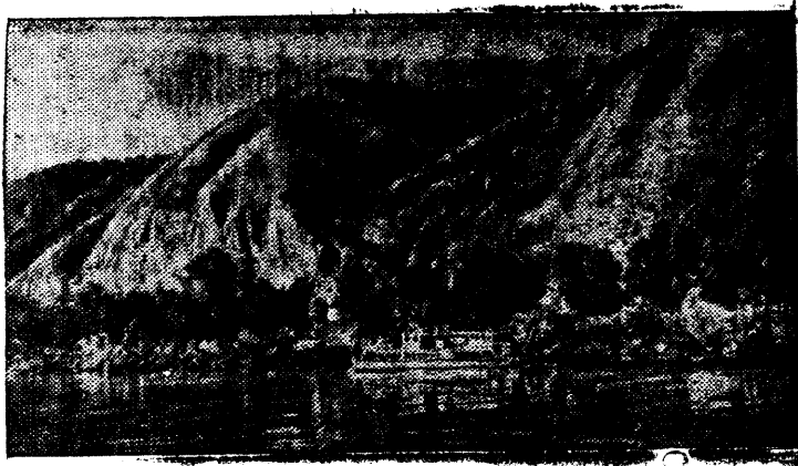
Жигулевские горы в районе строительства Куйбышевского гидроузла.