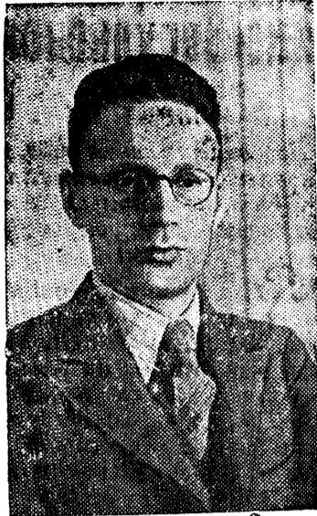
Участник турнира — чемпион СССР гроссмейстер М. Ботвинник (Ленинград).