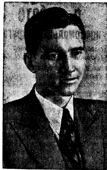
Участник чемпионата — чемпион Эстонской ССР гроссмейстер П. Керес.