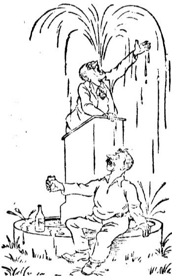
Бракодел: Как не выпить за здоровье такого руководителя! Рис. В. Лисевича.

Некоторые хозяйственники, извергая потоки красноречия о борьбе с дезорганизаторами производства, на деле миндальничают с бездельниками, рвачами, бракоделами.