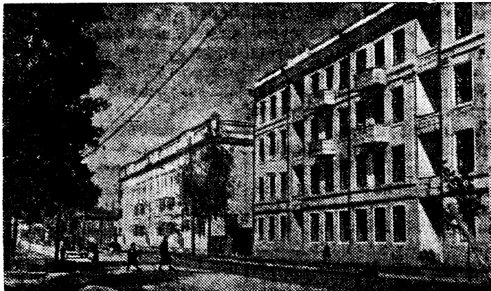
Советская улица в городе Ишмар Ола (Марийская АССР). На переднем плане—жилой дом, выстроенный в годы Третьей Сталинской Пятилетки.