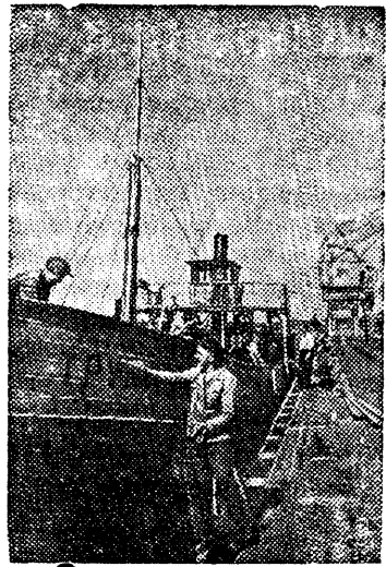
Ремонт парохода, затопленного белофиннами и поднятого советскими зэроновцами.