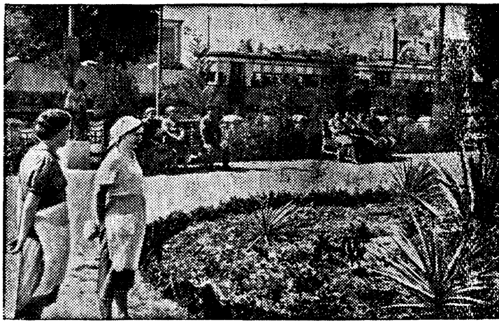
Один из уголков сквера

Рабочие и служащие текстильного комбината в г. Кировабаде (Азербайджанская ССР) оборудовали замечательный сквер.