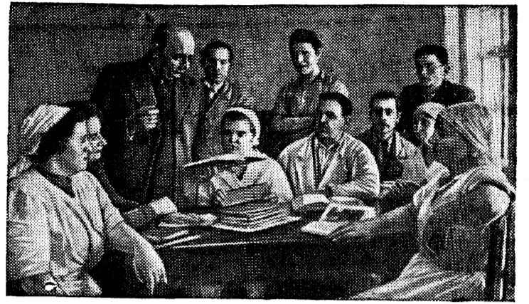
Рабочие шоколадной фабрики в г. Каунас (Литовская ССР) на беседе о Сталинской Конституции.