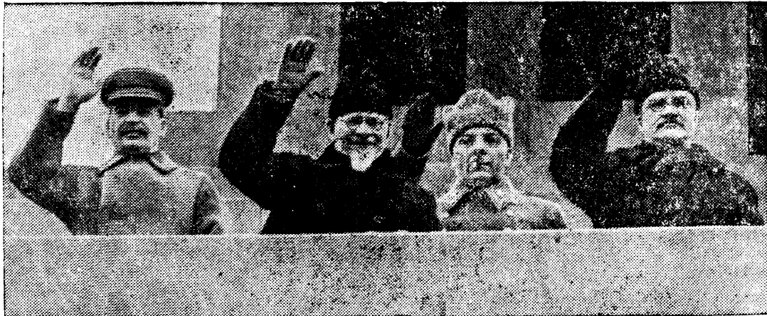
Слева направо товарищи: И. В. Сталин, М. И. Калинин, К. Е. Ворошилов и В. М. Молотов на трибуне мавзолея.

Празднование в Москве XXIII годовщины Великой Октябрьской Социалистической революции.