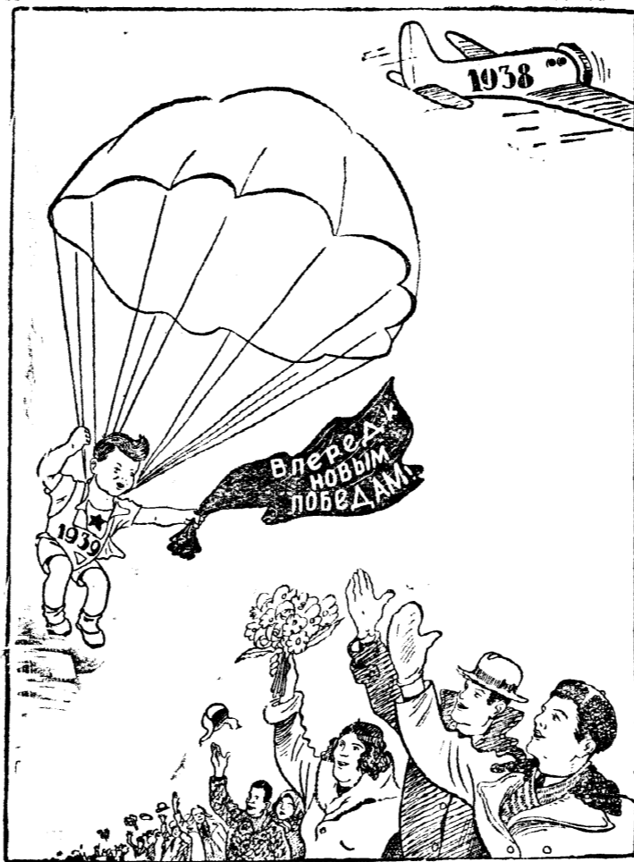
С Новым годом, с новыми успехами!