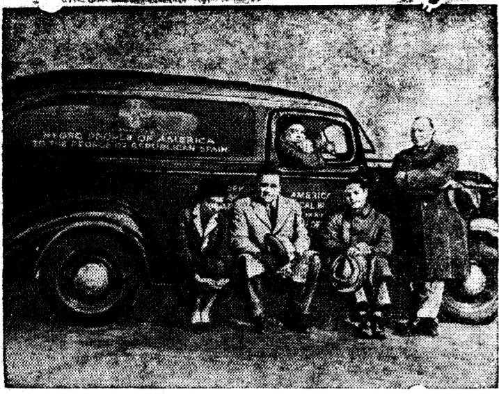
На снимке: Санитарный автомобиль, купленный на средства негров-жителей США и предназначенный для отправки в республиканскую Испанию. На автомобиле надпись: „От негров США“ — народу республиканской Испании.