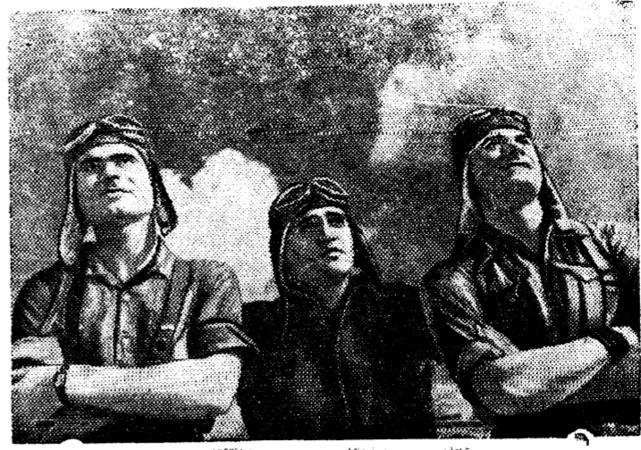
На снимке: Молодые летчики следят за полетом эскадрильи республиканских самолетов.