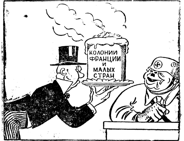
Британия всегда охотно несет жертвы за дело мира. Рисунок Ю. Дмитриева и Г. Вальк. Бюро-клише ТАСС.