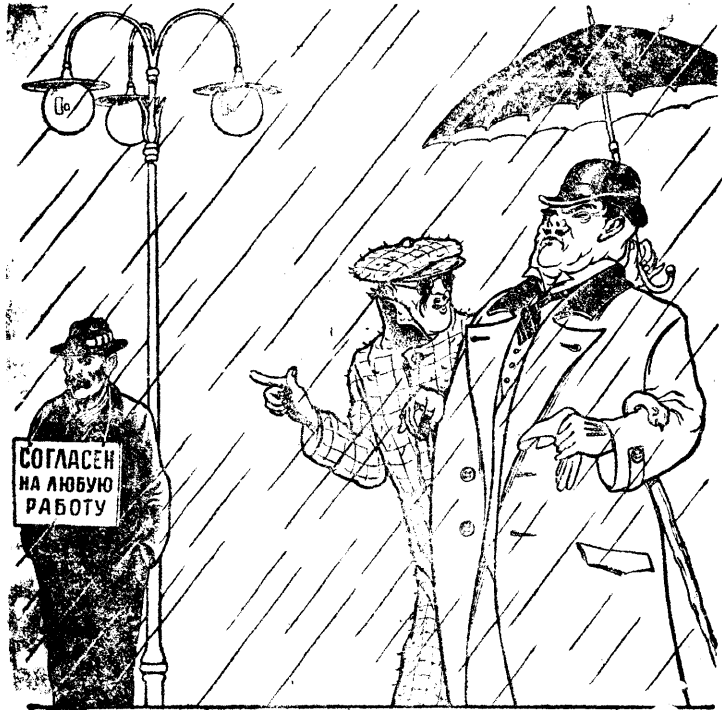
— Он врет, я ему предлагал работу—он отказался... — Что вы ему предлагали? — Стать штрейкбрехером. Рисунок К. Теодоровича по теме О. Бантле. Бюро-клише ТАСС.