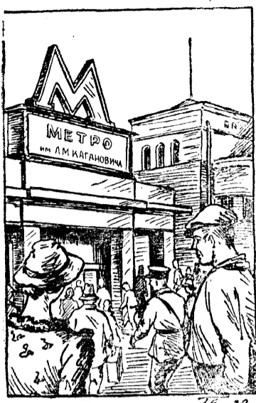
Советская марка, пользующаяся заслуженной любовью широкого потребителя.

В городе Миннеаполисе безработные выставили пикеты у всех мест общественных работ в знак протеста против увольнения рабочих. Между безработными и полицией произошло кровопролитное столкновение. Полиция пустила в ход оружие, бомбы со слезоточивым газом. Один рабочий убит, 17 ранены. Власти временно приостановили все общественные работы. (ТАСС).