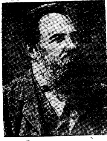
На снимке Ф. Энгельс—один из основателей и руководителей I-го Интернационала.