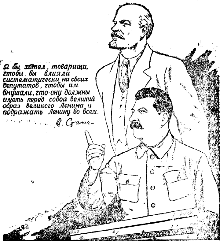
Рисунок Г. Бедарева и Г. Вальк.