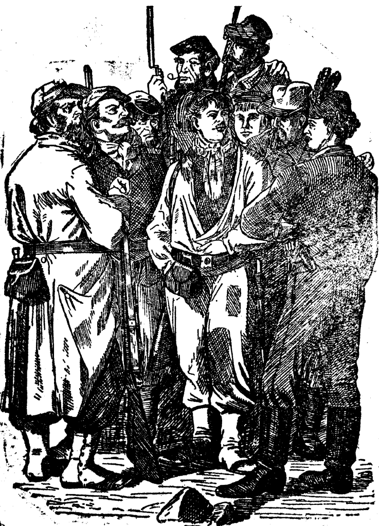
ТИПЫ КОММУНАРОВ ПАРИЖСКОЙ КОММУНЫ 1871 Г.

Воодушевленные вашей победой, мы обязуемся по-большевистски подготовиться к «сбору урожая» (ТАСС).