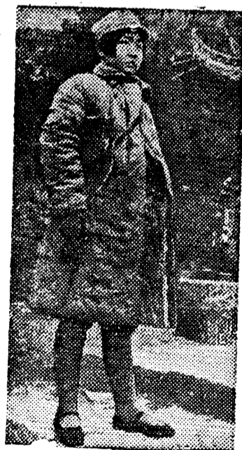
Студентка-китайка в боевом вооружении.

В ЦЗЯНСУ (КИТАЙ) СФОРМИРОВАН СТУДЕНЧЕСКИЙ БАТАЛЬОН, В СОСТАВ КОТОРОГО ВХОДЯТ 150 КИТАЙЦОВ-СТУДЕНТОВ.