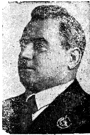
Тов. И. Д. Папанин.

Привет, наша могучая отчизна! Мы полны чувства глубокой благодарности нашему великому народу, Центральному Комитету большевистской партии, советскому правительству, вождю и другу товарищу Сталину. Огромное доверие оказали они нам, посылая нас в экспедицию на дрейфующую льдину. На нашу долю выпала великая честь — первыми в истории мира исследовать пустынные области земного шара, куда никогда еще не проникал человек. Производя многочисленные наблюдения в неизведанном краю, мы каждую минуту ощущали, что за нами следит вся наша могучая родина и это вселяло в нас неиссякаемую энергию, вдохновляло на борьбу с суровой стихией. Нам нестрашны были стужа и метель Северного полюса. Нас согревали лю-