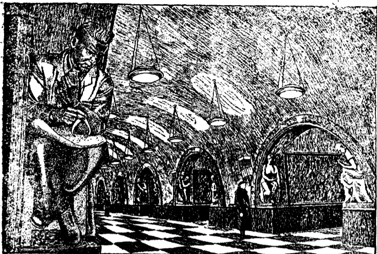
Станция метрополитена „Площадь Революции“. Скульптурное оформление выполнено заслуженным деятелем искусства граф. М. Г. Манисером.