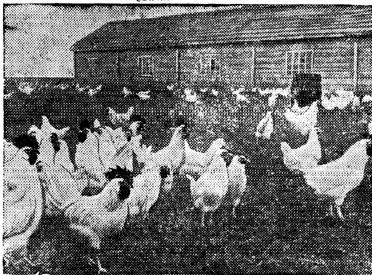
Общий вид птицефермы.