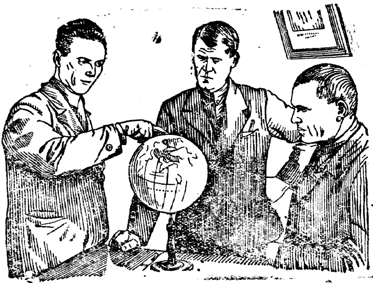
НА СНИМКЕ: Подготовка к очередному занятию по географии.

На общеобразовательных курсах для коммунистов одиночек, организованных Бершадским районом ВКП(б) (Украина).