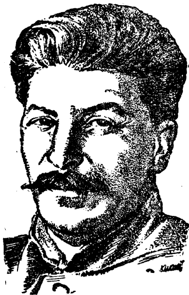
Иосиф Виссарионович СТАЛИН.

Товарищ Сталин поставил перед железнодорожниками задачу—грузить 75—80 тысяч вагонов в день. В 1936 году, выполнив это задание т. Сталина, железнодорожники обратились к правительству с просьбой объявить 26 июля—день приема железнодорожников руководителями партии и правительства— Всесоюзным днем железнодорожного транспорта . Центральный Исполнитель-