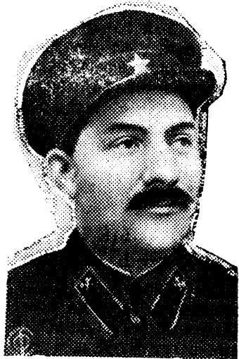
Лазарь Моисеевич КАГАНОВИЧ.