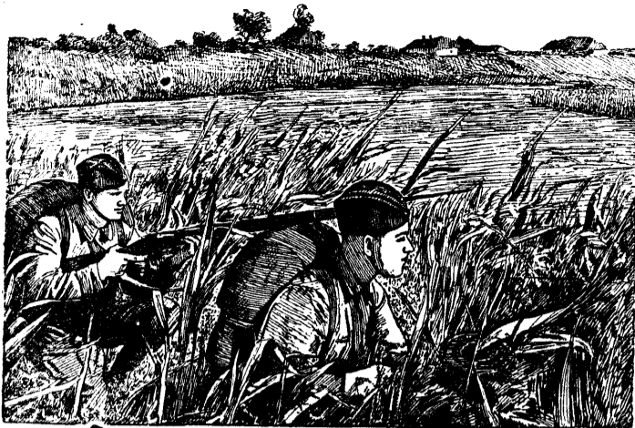
На рис.: Бойцы подразделения лейтенанта Баранова в засаде, во время практических занятий (Харьковский военный округ).

Рис. с фото В. Александрова (Союзфото) „Прессклише“.