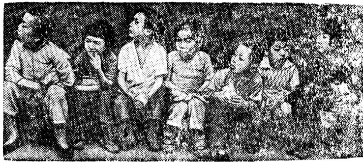
На сн.: Сироты, оставшиеся на попечении одного из обществ содействия беженцам.

Варварские бомбардировки японскими самолетами китайских городов и селений лишают тысячи маленьких ребят Китая родителей и крова.