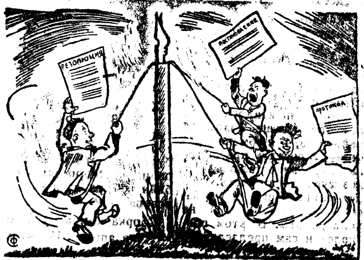
Карусель. Невелик их хор нестройный. Но еще придется нам Дать не раз отпор достойный Бюрократам, болтунам.

ОТ РЕДАКЦИИ: Считаем, что окрпрокурор немедленно вмешается в дело незаконного перевода зарплат учителям через кооперативы и в дело обчетов, незаконных вычетов при выдаче зарплат учителям в Кондинском районе.