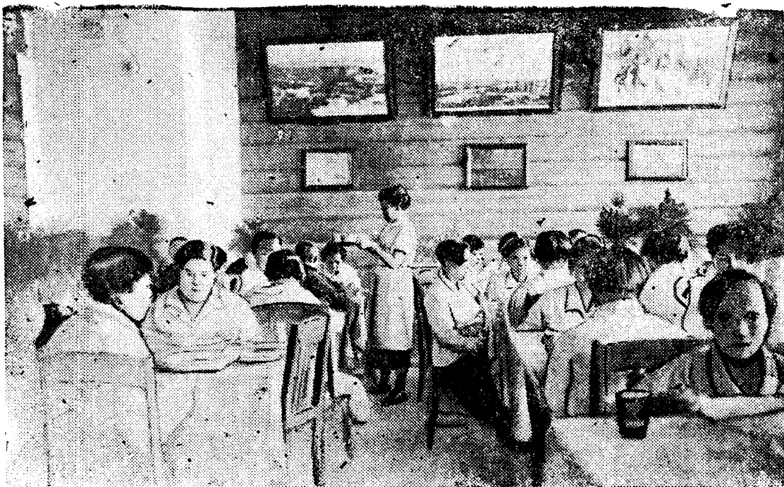
НА СНИМКЕ: столовая для учащихся акушерско-фельдшерской школы, созданной за пятилетие округа в поселке Остяко-Вогульск.

Французское правительство разрешило все собрания, митинги антифашистских партий, запретило митинги фашистов. ТАСС.