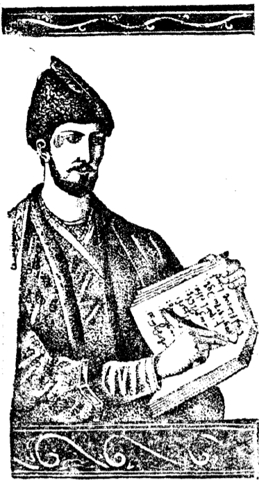
Шота Руставели

В этом году исполняется 750 лет со дня рождения Шота Руставели, величайшего грузинского поэта, автора бессмертной поэмы „Витязь в тигровой шкуре“.