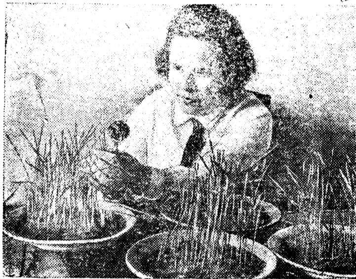
Перед весенней посевной

Миргородская контрольно-семенная лаборатория Госсортфонда (Харьковской области) производит множество анализов образцов семян, на всхожесть, сорность, влажность и т. д. Образцы доставляются колхозами, совхозами, МТС.