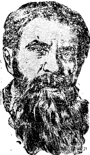
Отто Юльевич ШМИДТ—начальник полярной экспедиции

При таких условиях вряд ли можно вырастить новых стахановцев. Нужно правильно организовать труд, организовать соревнования, выдвигать хороших работников, заботиться о них, помогать им стать стахановцами.