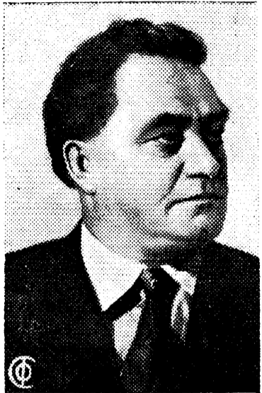
Димитров — Генеральный Секретарь Исполкома Коминтерна.