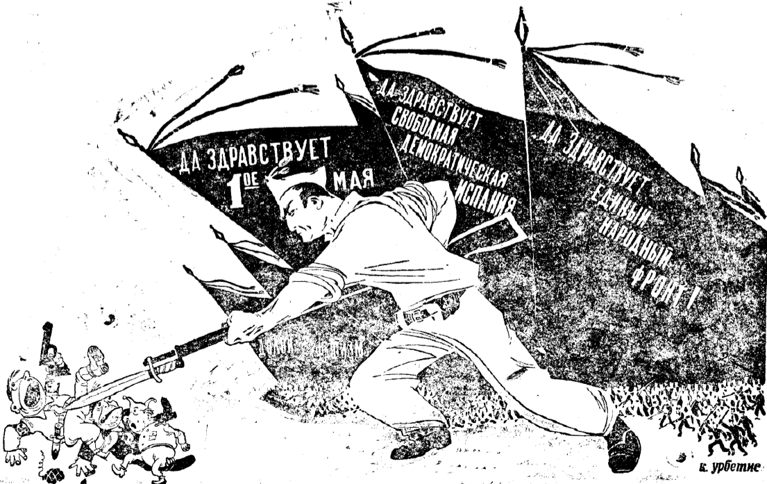
„Братский привет рабочим Испании, ведущим героическую борьбу против фашизма и иностранных интервентов!“

От имени Исполкома Коммунистического Интернационала Генеральный секретарь Г. ДИМИТРОВ.