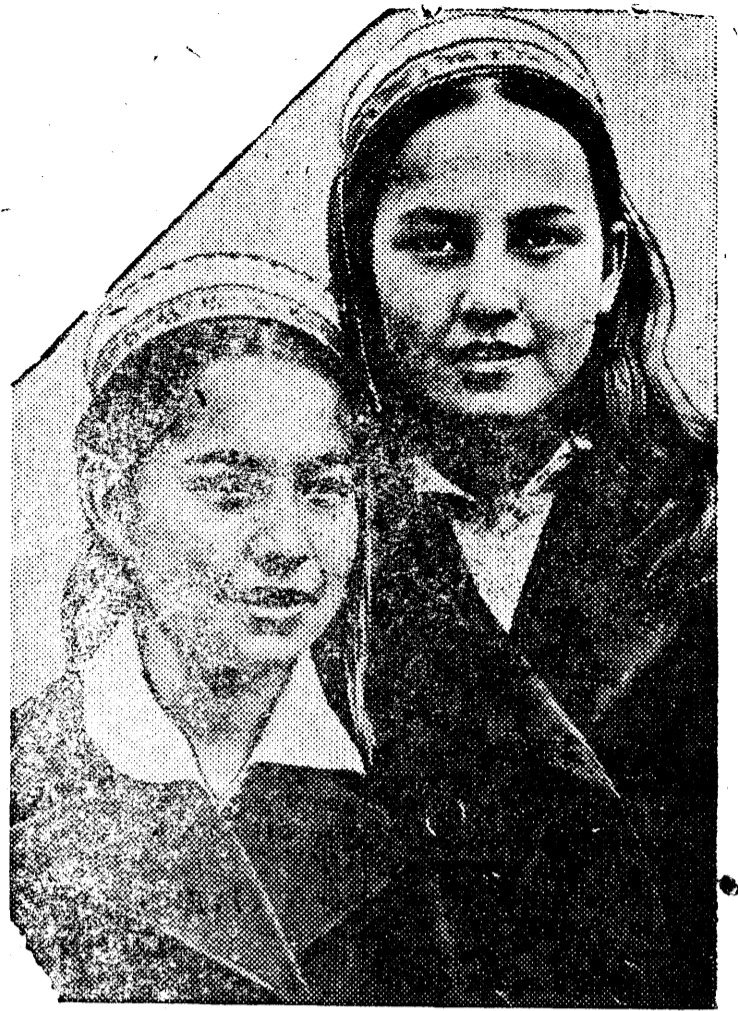
Узбекские девушки—участницы декады узбекского искусства в Москве