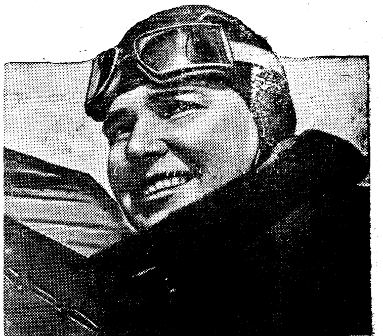
П. Д. Осипенко в кабине самолета.

Недавно летчица-орденоносец Полина Денисовна ОСИПЕНКО совершила выдающийся высотный полет на гидросамолете, перекрыв международный рекорд высотного полета на гидросамолете для женщин.