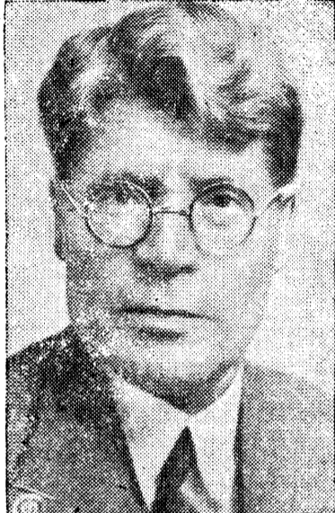
Тов. И. М. Губкин—Президент конгресса

открытия новых природных богатств, так и в геологическую науку у себя на родине и за границей. Геологические карты СССР охватывают свыше 8,5 миллиона квадратных километров советской территории, причем, вместо белых пятен дореволюционных карт, прорезанных малочисленными и редкими маршрутами и съемками, советские геологические карты засняли даже такие районы, как Арктику и Далекий Север—Восток СССР.