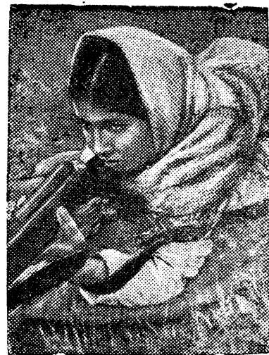
Пил'хо Керимова пушкан евл'т естл'.

Ям комсомол еви Азейбард- жан евл'т Ворошиловский колхоз евл'т Маня Керимова л'ув колхо- сетн стрелковый кружок верс.