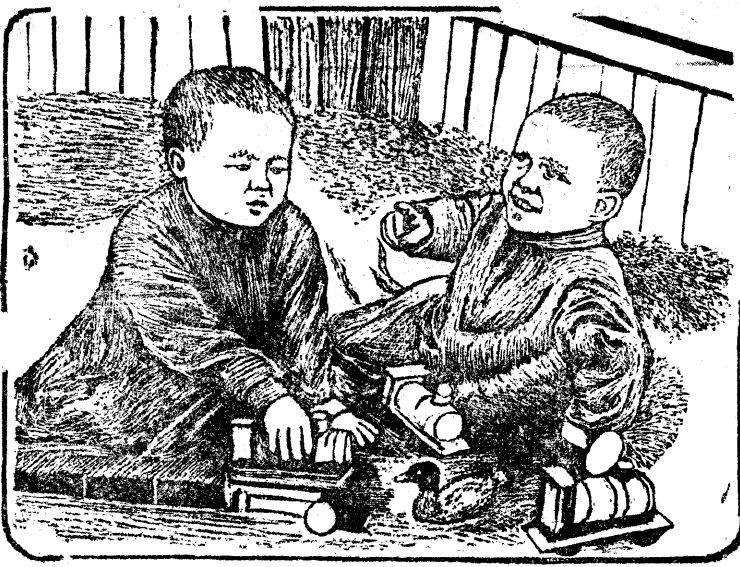
Любимые игрушки детей в детсадишке поселка Остяко-Вогульск.