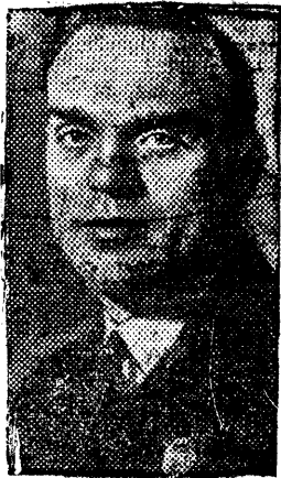
С. А. Леваневский

Свой перелет я совершаю по маршруту, который, в последствии всего, вероятно, и будет трассой воздушной линии Москва—Северная Америка. До полюса мы летим почти по тому же пути, по которому шли Чкалов и Громов. От полюса наш маршрут проходит по меридиану, противоположному меридиану Москвы. Посадку думаем сделать в городе Фербенкс на Аляске. Фербенкс является самым большим промышленным городом на