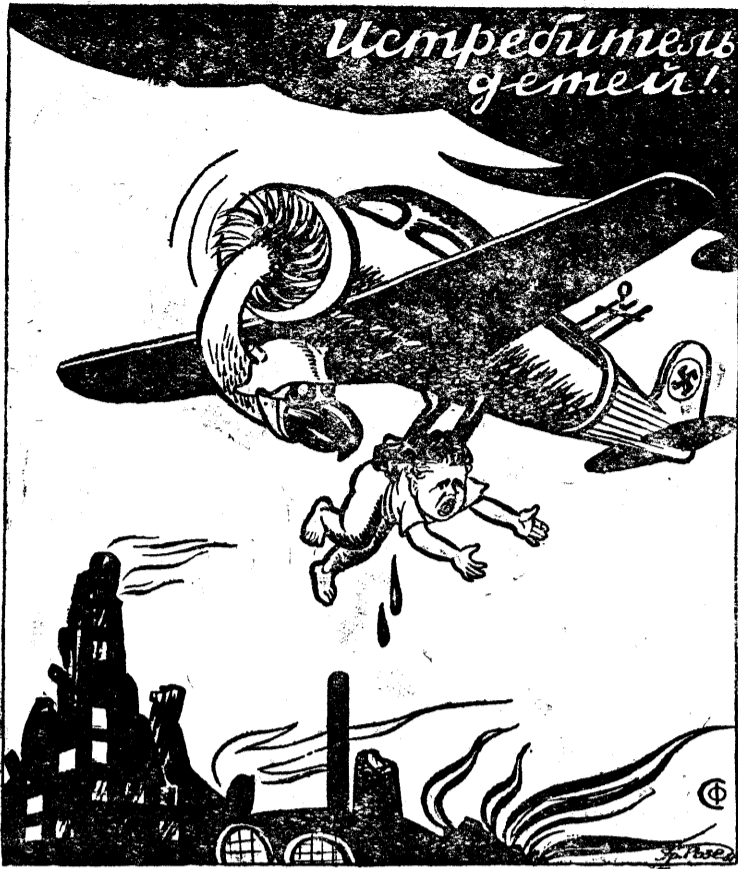
Лицо фашистской авиации.