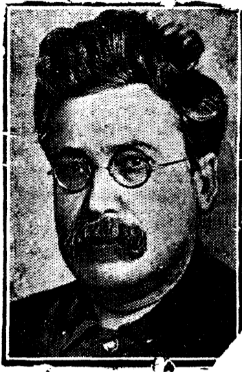
т. Е. Ярославский.

В конце собрания выступил тов. Ярославский, встреченный бурными аплодисментами. Он благодарил рабочих и трудящихся Омска за то доверие, которое они оказали ему, выдвинув его кандидатом в депутаты Верховного Совета. Ярославский в своей содержательной речи рассказал о победах, одержанных нашей страной