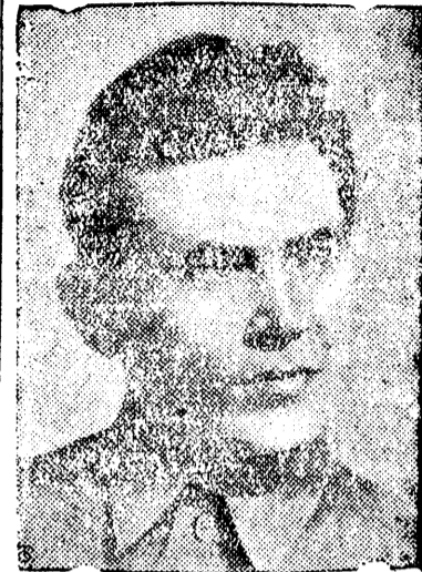
Н. И. Ежов—Народный Комиссар Наркомвнудела

Центральная Избирательная Комиссия по выборам в Верховный Совет СССР.