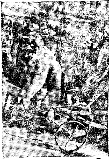
В полеводческой бригаде.

Выпавшие по всей Болгарии проливные дожди и град нанесли крупные убытки крестьянским хозяйствам многих районов. В большинстве районов центральной, а также южной Болгарии уничтожено от 30 до 100 процентов посевов. По сообщению Болгарской печати, население пострадавших районов находится в отчаянном положении, так как не имеет семян, а также необходимых средств для восстановления размытых посевов и разрушенных хозяйств. ТАСС.