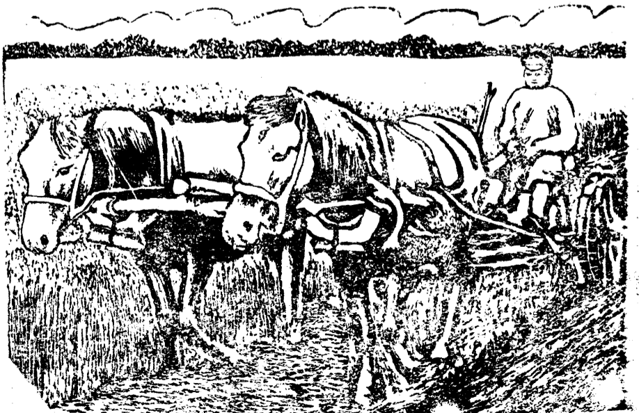
На колхозных лугах наступила горячая пора сенокоса.