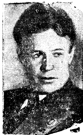
НА СНИМКЕ: Герой Советского Союза летчик Молоков.