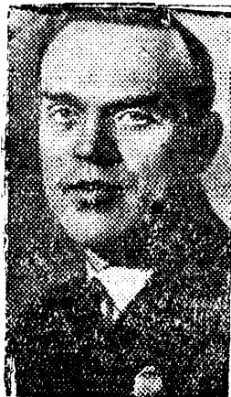
НА СНИМКЕ: Герой Советского Союза летчик Леваневский