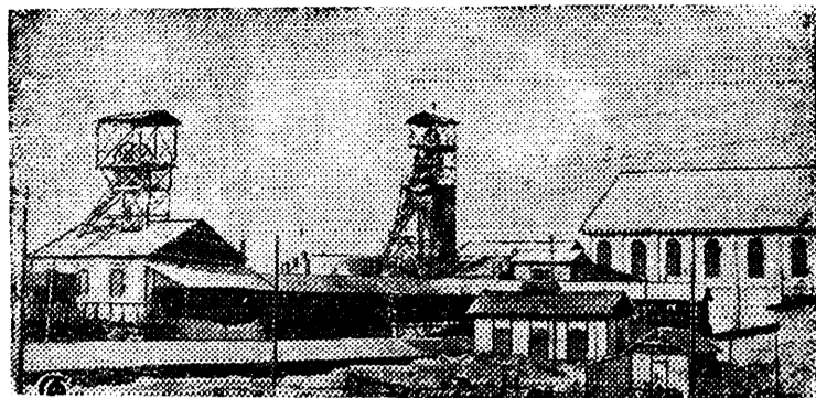
НА СНИМКЕ: общий вид шахты имени Сталина, бывшая Центральная-Ирмино (Кадиевский район, Донбасс), где Алексей Григорьевич Стаханов поднял знамя стахановского движения.