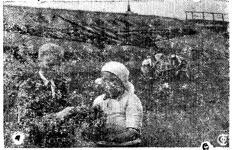
На озеленение Магнитогорска в текущем году ассигновано 750 тыс. руб. В течение весны и лета посажено цветов—летников 490 кв. метров, ковровых цветов—1583 кв. метра, газонов—около 60 тыс. кв. метров, высажено в грунт более 450 деревьев, кроме того более 6 с половиной тыс. штук кустарниковых черенков. Так степной город постепенно становится зеленым. НА СНИМКЕ: общий вид одного из цветников на заводском дворе. Цветник изображает самолет „АНТ“.

полнила на 201 процент. Она взяла на себя обязательство дать стране еще 10 тонн рыбы. Председатель артели М. ПАРФЕНОВ. Сургутский район.