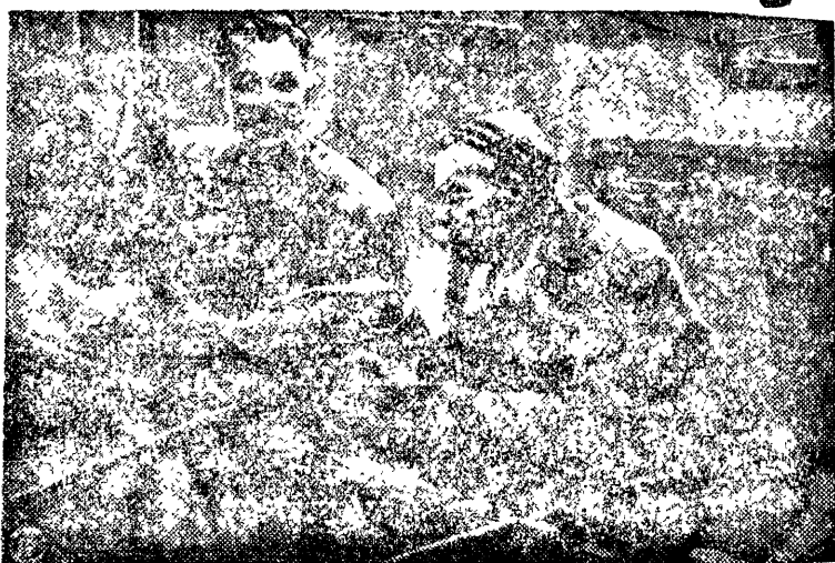
Художественная выставка на „15 лет РККА“

Постановление предупреждает всех руководителей колхозов, МТС, земорганов, что нарушение установленных норм, содержание посторонних колхозу лиц будет рассматриваться как расхищение колхозного имущества и виновные будут привлекаться к ответственности.