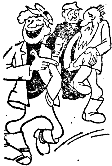
Где нет учета, проверки исполнения и борьбы за организацию труда—там прогуды.