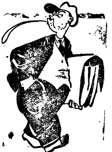
Интегралщик: Тфу! Паши приказчи, и опять беда-бедальничать.

На Самаровском базаре в ларьках интеграла кроме детских игрушек ничего нет.